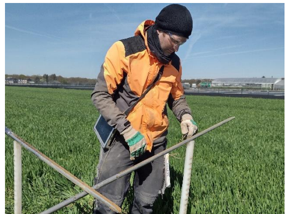
Beurteilung der Bodeneigenschaften durch den Geologischen Dienst NRW

Im Rahmen der Bodenuntersuchungen führen die Mitarbeiterinnen und Mitarbeiter des Geologischen Dienstes NRW Sondierungen (Handbohrungen) bis maximal 2 m Tiefe durch. Stellenweise werden auch Aufgrabungen angelegt, aus denen Bodenproben entnommen werden.